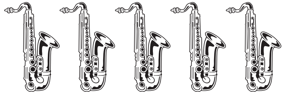
5 Saxophone vlnr: 1 x Bari, 2-3 x Alto, 2-3 x Tenor

Falls kein oder mittelhohes Podest: dann stehen die Posauner; falls hohes Podest: dann sitzen sie (dann 4/5 Stühle nötig)