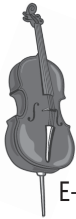
E- und/oder Kontrabass Stehend