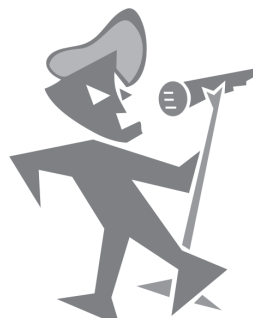
Sänger und/oder Sängerin