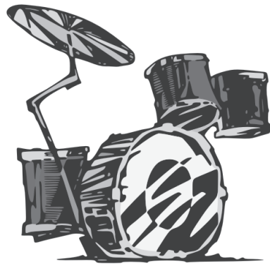
Schlagzeug Sitzend / eigener Hocker