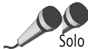
Solo und Ansage